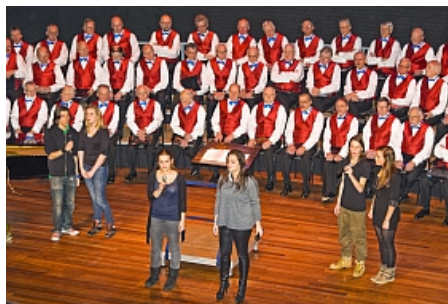
Vughts Mannenkoor met winnaars Maurick Muziekconcours en Maurick-koor

Het gaat goed met het Vughts Mannenkoor. Er hebben zich na de zomer spontaan vier nieuwe leden aangemeld bij ons koor. De instroom gaat dus gewoon door en dat is belangrijk voor de continuïteit en kwaliteit. We blijven met 70 man op volle sterkte!