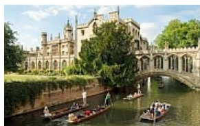
'Punteren' bij een bridge op de rivier de Cam.

Klik hier om een vriend of kennis op deze gratis nieuwsbrief te attenderen