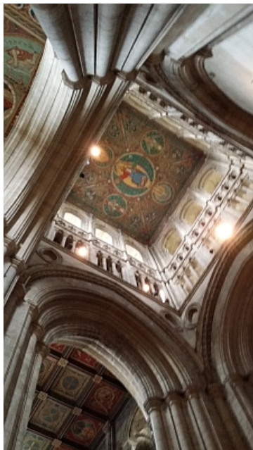
Rechts: detail plafond