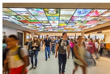
Interieur Maurick College

Nog een paar repetities voor het vriendenconcert in het Maurickcollege op vrijdag 4 juli. Om 19.30 uur gaan we speciaal voor onze vrienden en vriendinnen weer een concert verzorgen. Dit keer samen met de vocalgroep 'Back on Track'. Een heel bijzondere combinatie en een genot voor het oor voor jong en oud.