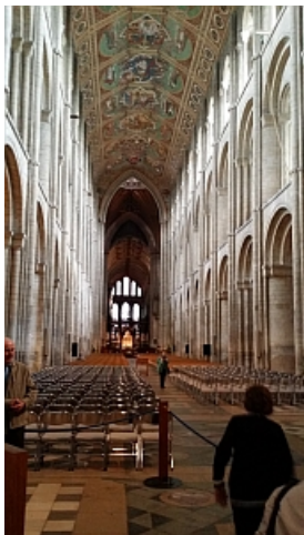
Boven: interieur Ely Cathedral